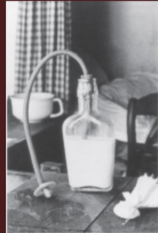
FIGUUR 4. Zuigfles met slang en speen, die in de wieg werd geplaatst. Deze vorm van zuigelingenvoeding werd toegepast in de tweede helft van de 19e eeuw.*